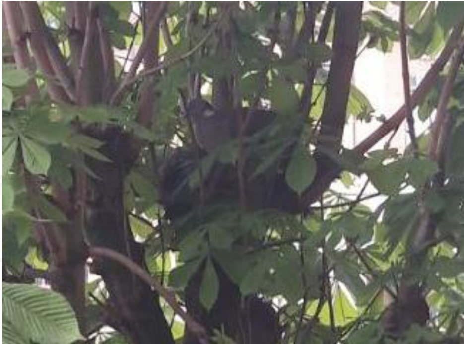
Poggibonsi, Piazza Mazzini, nido sull'albero