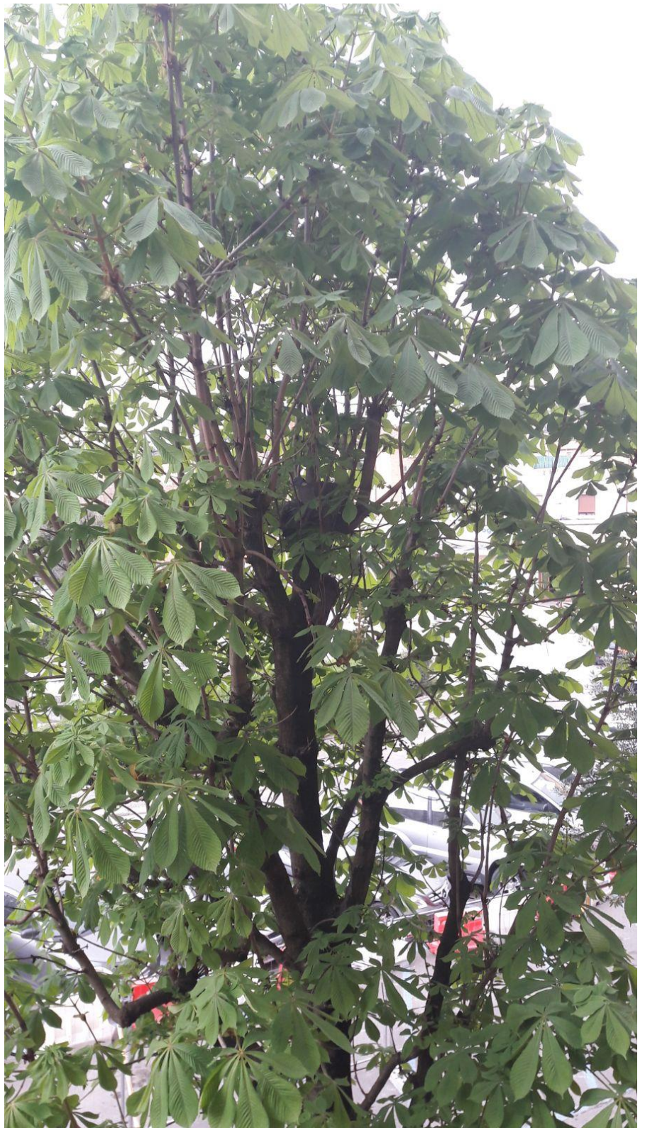
Poggibonsi, Piazza Mazzini, nido sull'albero